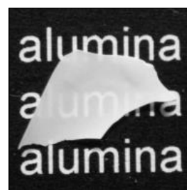
薄膜状α-アルミナの写真。 Photograph of film-type α-alumina.